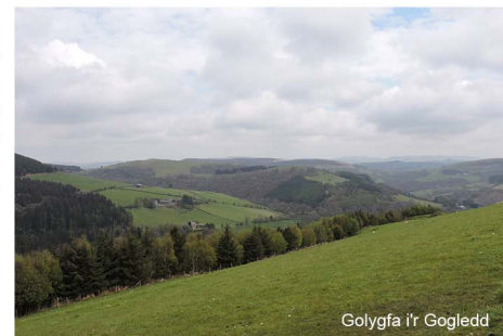
Golygfa i'r Gogledd

5. Pan fyddwch chi'n cwrdd â chornel llinell ffens ar ben y bryn serth hwn, ewch ymlaen gyda'r llinell ffens ar eich ochr dde i gwrdd â giât cae metel.