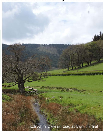
Edrych i'r Dwyrain tuag at Cwm Hir Isaf