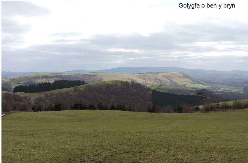
Golygfa o ben y bryn

Wrth gyrraedd Ffordd y Goedwigaeth edrychwch i'r dde lle byddwch yn gweld clawdd a llwybr isel yn diflannu i'r blanhigfa. Yn debygol mae hon yn ffin o'r parc ceirw. Dywedwyd bod cylchedd y parc yn saith milltir, wedi'i amgáu gan lannau a ffosydd ac oedd â ffens bren ar eu pennau yn wreiddiol.