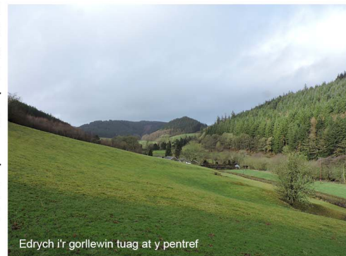
Edrych i'r gorllewin tuag at y pentref