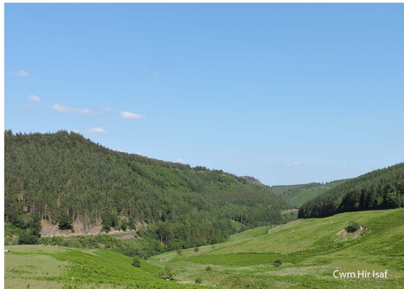
Cwm Hir Isaf

Wrth gyffordd y ffordd cadwch yn syth ymlaen a phasio gydag adeiladau fferm ar eich chwith. Mae'r llwybr yn parhau ar y ffordd leol yr holl ffordd yn ôl i'r pentref.